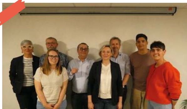
Permettre le développement harmonieux du territoire et un habitat accessible, équilibré et respectueux de l'identité locale.