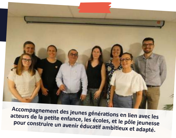
Accompagnement des jeunes générations en lien avec les acteurs de la petite enfance, les écoles, et le pôle jeunesse pour construire un avenir éducatif ambitieux et adapté.