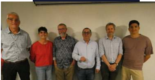
Amélioration concrète du quotidien en agissant sur les infrastructures, les déplacements et la sécurité sur l'ensemble de la commune.