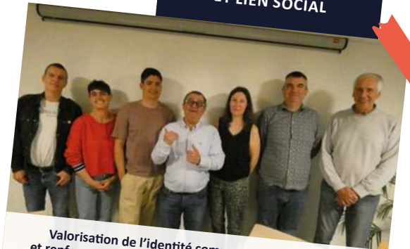
Valorisation de l'identité communale, de la culture et renforcement des liens entre générations et quartiers.