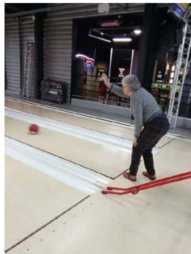
Sortie au bowling