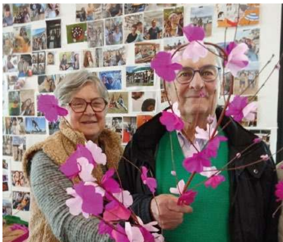
Atelier bricolage pour le printemps