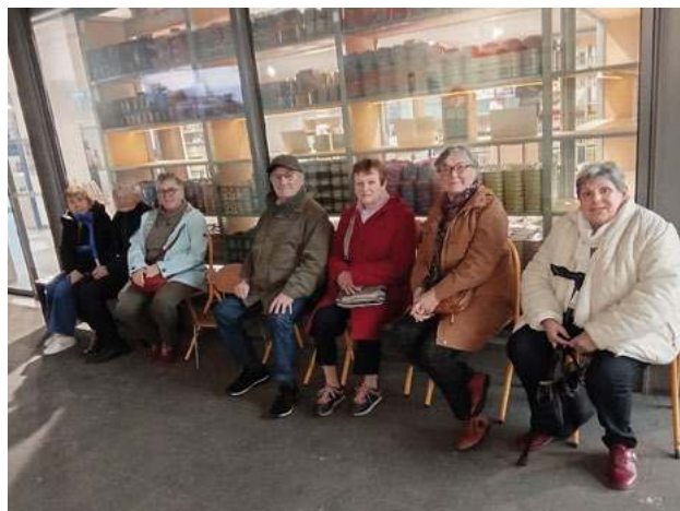
Balade à la côte sauvage avec un arrêt à la conserverie la Belle-iloise.