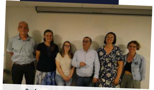
Renforcement des solidarités, lutte contre l'isolement et étude des solutions de logement adaptées à tous les parcours de vie.