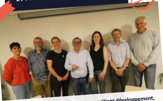
Actions pour l'environnement en conciliant développement, préservation des ressources et qualité de vie.