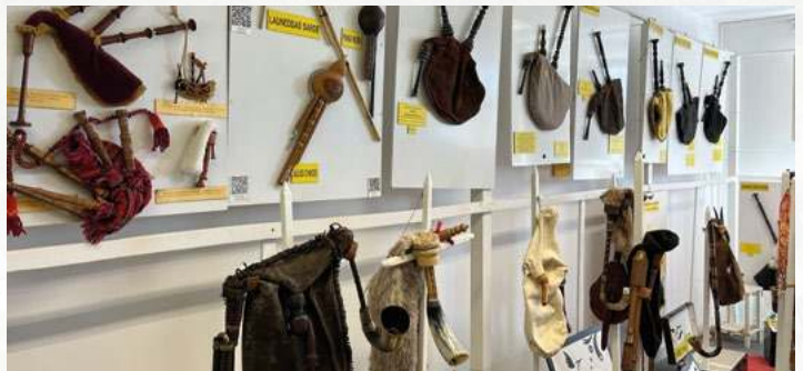
Exposition de biniou à l'intérieur de la salle Mane Angl